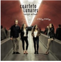
Cuarteto Lunares 2016/Ruta records