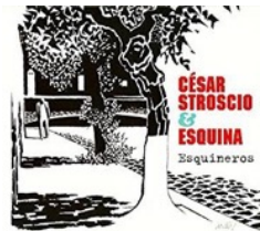
César Strocio-Trio Esquina 2016/Buda musique