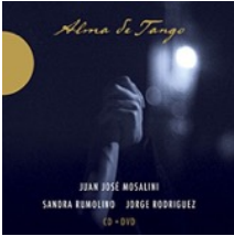
Juan-José Mosalini 2015/accords croisés