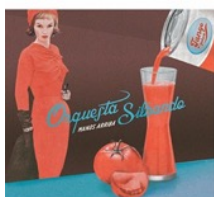
Orquesta Silbando 2015/Orquesta Silbando