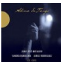
Juan-José Mosalini 2015/accords croisés