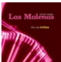
Las Malenas 2015/Label Triton

Voici une liste non exhaustive de CDs qui seront mis en vente durant le festival. Les sorties sont toutes récentes, 2015 ou 2016, et deux albums sortiront en 2017