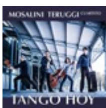
Mosalini- Teruggi 2017/label