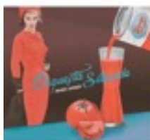
Orquesta Silbando 2015/Orquesta Silbando