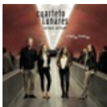
Cuarteto Lunares 2016/Ruta records