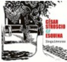
César Stroscio-Trio Esquina 2016/Buda musique